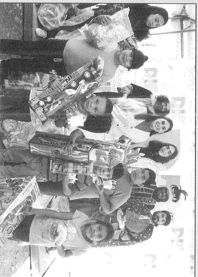
Los pequeños se mostraron felices con sus regalos.

Personal del DIF, Protección Civil y de otras dependencias del Municipio de Juárez, se sumaron a la tarea que consistía en llevar un momento de alegría a niños juarenses de zonas vulnerables conviviendo, disfrutando de un pedazo